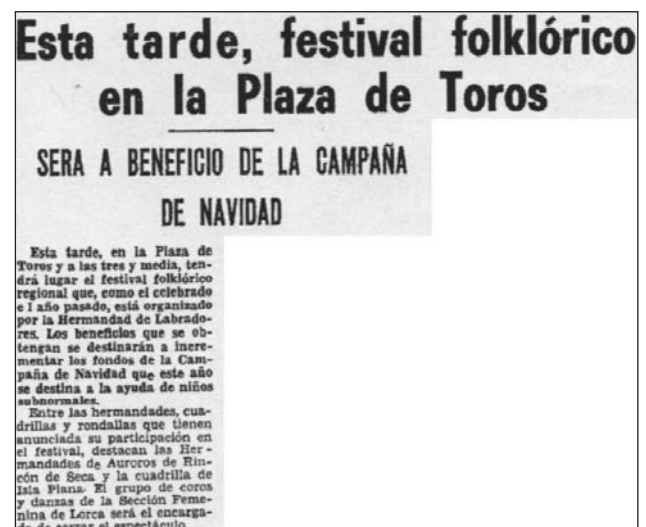
Lámina 5. Noticia de La Verdad , 27-12-1968. Festival folclórico en la plaza de toros.