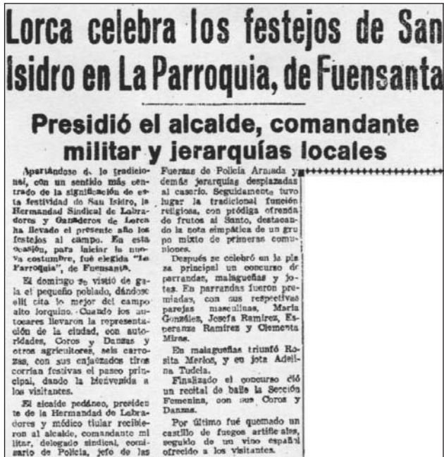
Lámina 2. Noticia de La Verdad , 19-5-1959. Primer festejo de San Isidro fuera de la ciudad, en La Parroquia.